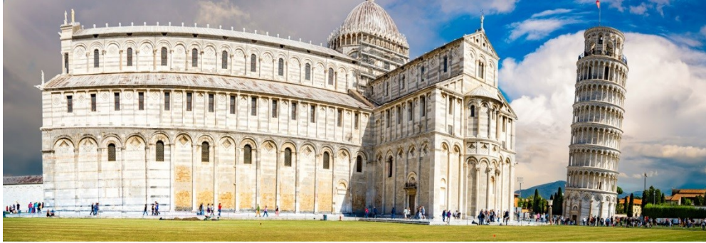
de Pisa e o maior exemplo do estilo Românico toscano.

A Catedral de Pisa , dedicada à Virgem Maria, é um templo católico da Itália, localizado na cidade de Pisa. É a sede da Arquidiocese