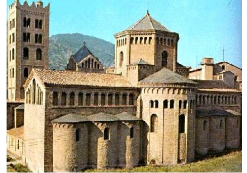
Igreja de Santa Maria de Ripoll, Gerona