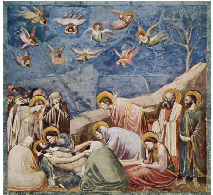
A lamentação de Giotto di Bonbone - pintura da Capela Degli Strovegni em Pádua, Itália.

Obras destacadas: O Casal Arnolfini e Nossa Senhora do Chanceler Rolin.