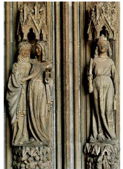
A Visitação e a Sinagoga Catedral de Friburgo

As esculturas estão ligadas à arquitetura e se alongam para o alto, demonstrando verticalidade, alongamento exagerado das formas, e as feições são caracterizadas de formas a que o fiel possa reconhecer facilmente a personagem representada, exercendo a função de ilustrar os ensinamentos propostos pela igreja..