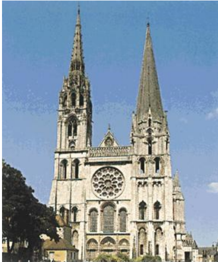
Catedral de Chartres

A primeira diferença que notamos entre a igreja gótica e a românica é a fachada.