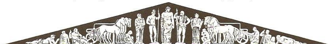
Fig.5.10. Reconstrução esquemática do frontão leste do templo de Zeus em Olímpia. A ação dos homens e do tempo destruiu os frontões dos templos gregos, cujas peças que sobraram encontram-se espalhadas por diversos museus da Europa.

Os capitéis eram enfeitados e a arquitrave, dividida em três faixas horizontais (fig. 5.8). O friso também era dividido em partes ou então decorado por uma faixa esculpida em relevo. A cornija era mais ornamentada e podia apresentar trabalhos de escultura (fig. 5.8).