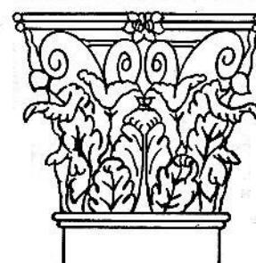
Fig. 5.9. Capitel coríntio.